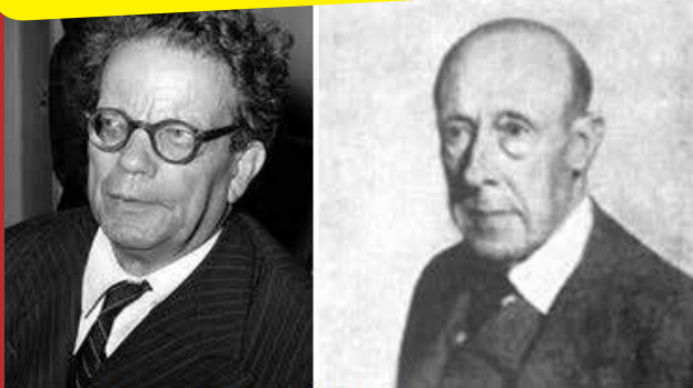
Giovanni Papini e Domenico Giulioti