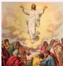
"Padre, consacrali nella verità!"